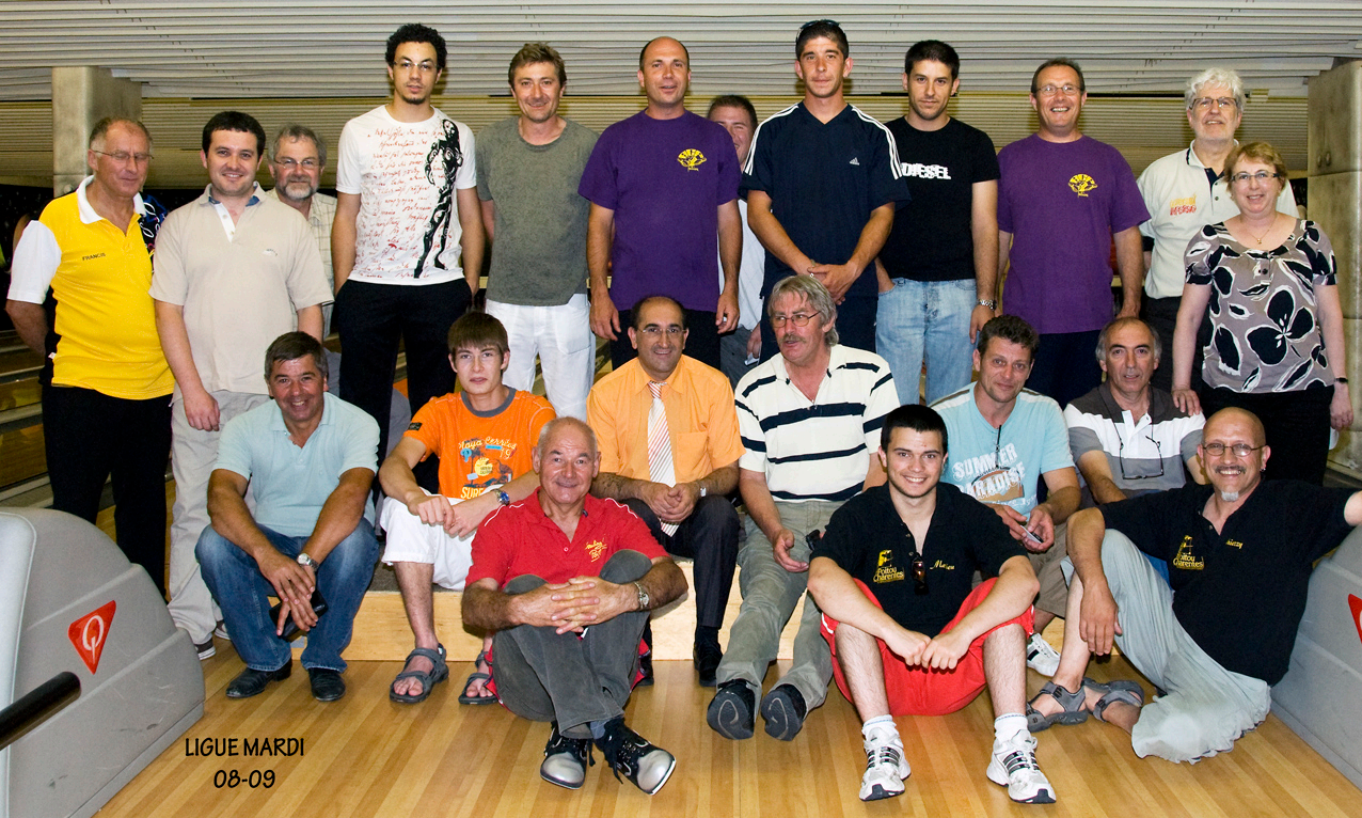
LIGUE MARDI 08-09